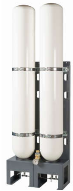
B100 / 365 bar

Auf dem verlängerten Grundrahmen werden der Kompressor und bis zu 2 Speicherflaschen mit einem geometrischen Volumen von je 50 bzw. 80 Liter zum schlüsselfertigen System aufgebaut.