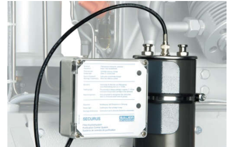
Filtersystem mit SECURUS Meldegerät

Das SECURUS System überwacht kontinuierlich die Filterpatronen-Sättigung durch Messung der Feuchte im Molekularsieb und zeigt Ihnen rechtzeitig direkt auf dem Display des Meldegerätes an, wann Sie die Filterpatrone wechseln sollten. Bei 100% Sättigung der Trocknerpatrone schaltet der SECURUS die Anlage automatisch ab. Nur in Verbindung mit P41/350!