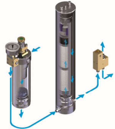
Filtersystem P41/350 (Abbildung ähnlich)