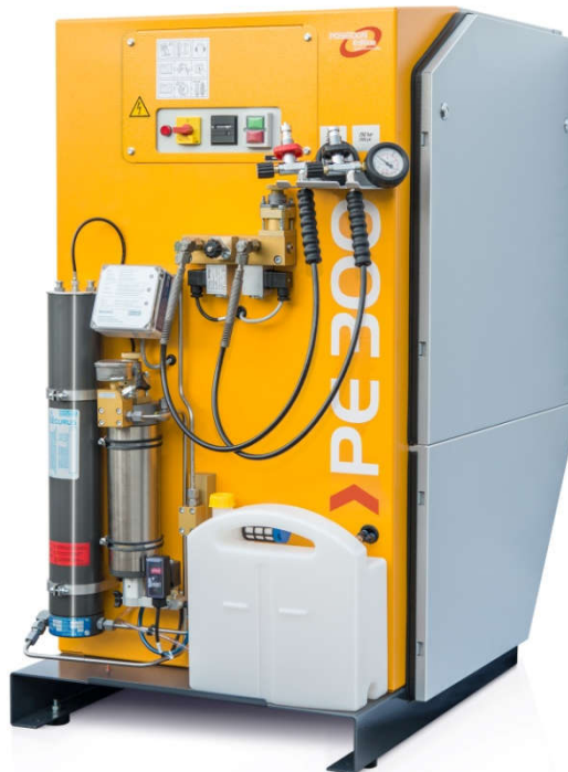
PE350-MVE mit Filtersystem P41/350, Umschalteinrichtung und SECURUS Filterpatronenüberwachung (optionale Ausstattung)